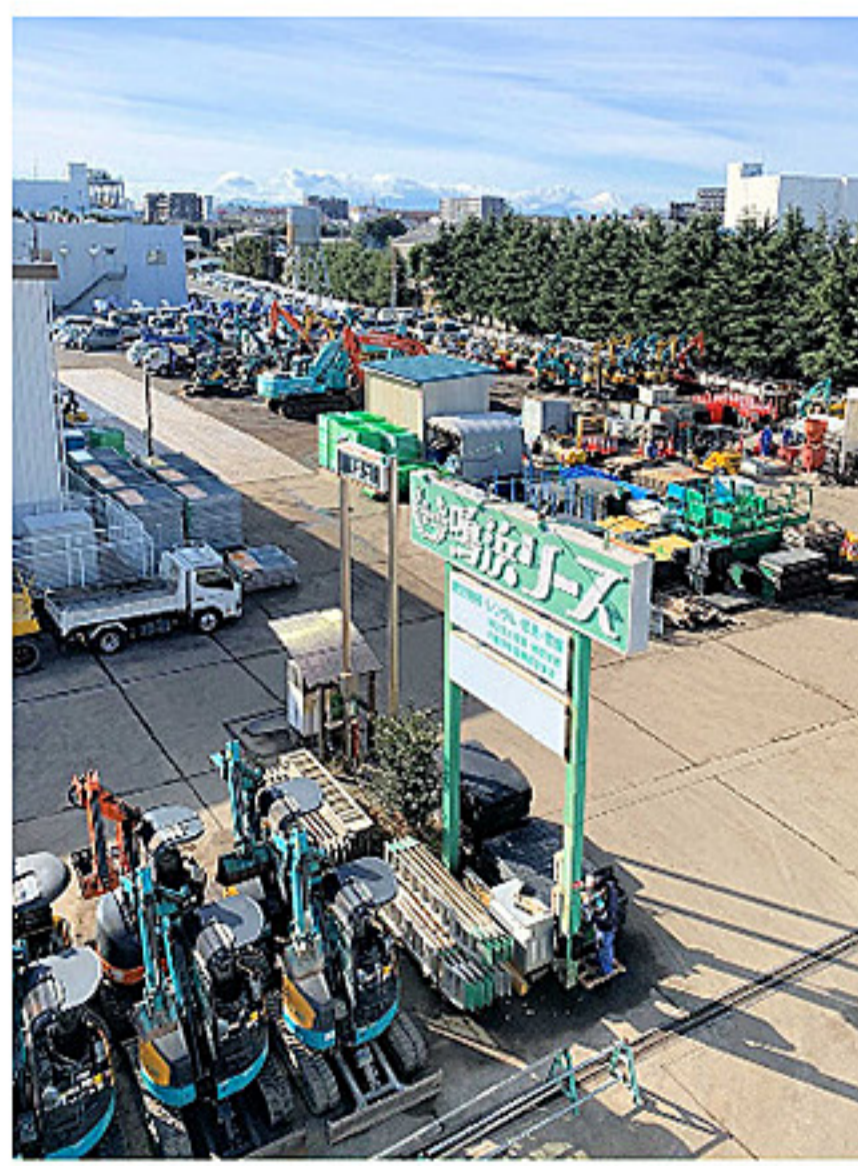
埼玉支店 営業部・技術部