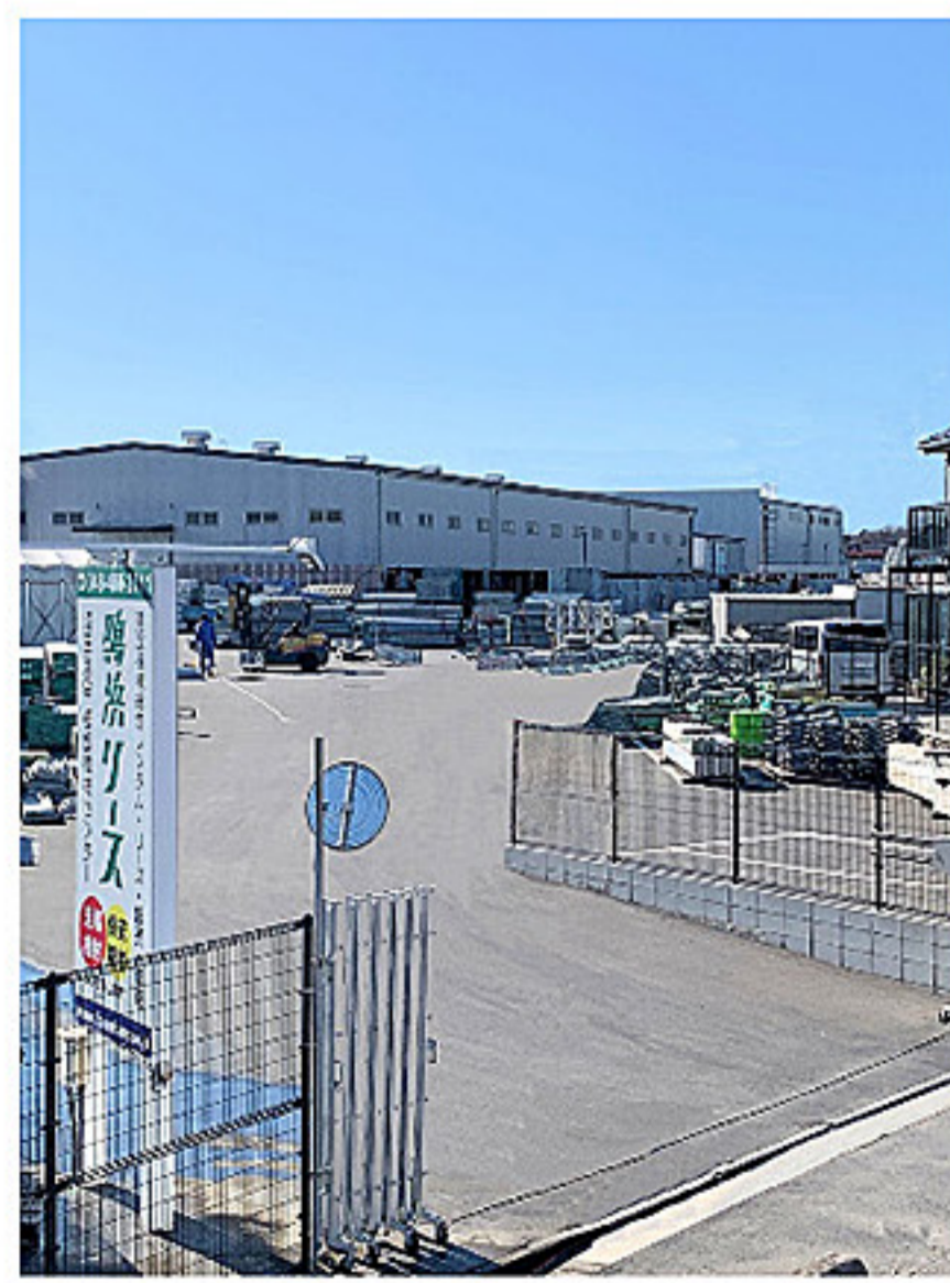
埼玉支店 仮設機材センター