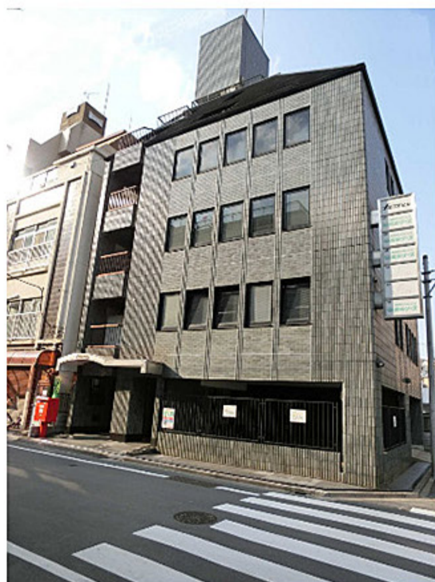
本社 (ナルハマビル)

転職を考えている方へ、履歴書は不要ですので、まず会社を見学をしてみませんか？実際に働いている様子を自分の目と耳でぜひ確かめてください。納得のいく転職になるようお手伝いいたします。