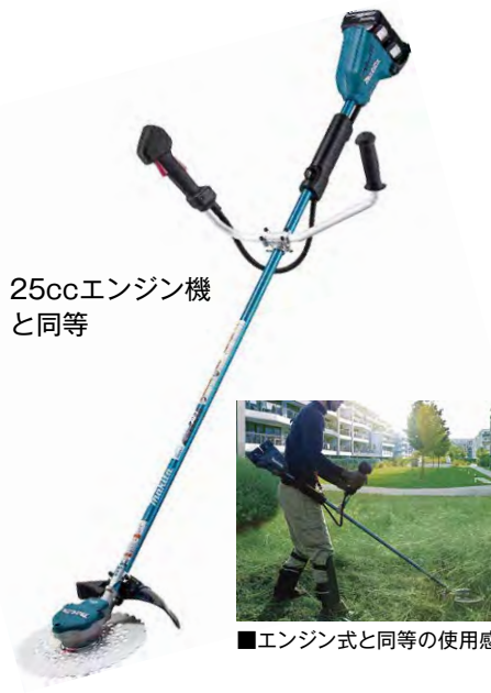
25ccエンジン機と同等