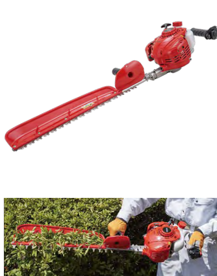
■軽量なので取り回し良好。