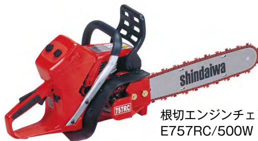
根切エンジンチェーンソー E757RC/500W (ルートカッター)