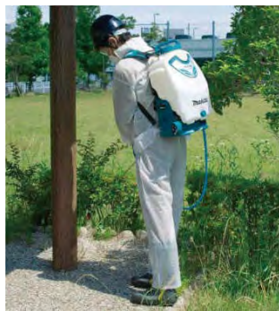
■背負って作業できます。