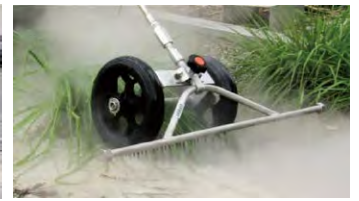
■レーキ型除草ガン