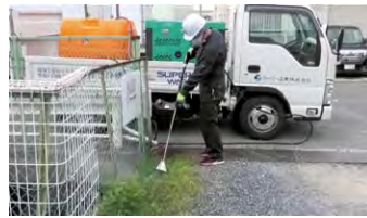
■ホーン型除草ガン