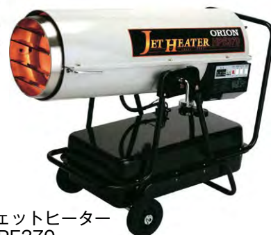
傾斜型ジェットヒーター HPE370