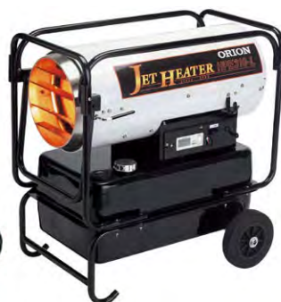
ジェットヒーター HPE310-L