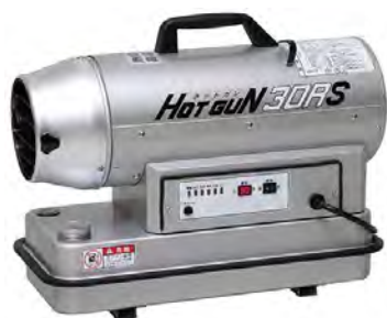
ジェットヒーターミニ HG30RS

■強力熱風ヒーターです。塗装やコンクリート打設後の乾燥に。暖房機としても使用できます。