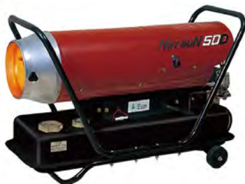
小型ジェットヒーター 50D