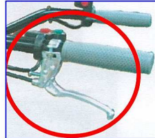
①左ハンドルにはブレーキレバーが付いています。