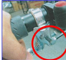
③もう一度ブレーキレバーを握ると解除されます。