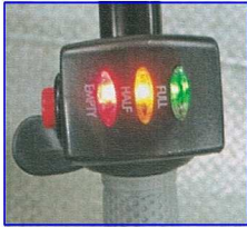
②バッテリーの残量計が点灯します。電源は何もしないとOFFになります。