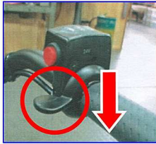
③スロットルスイッチを下げると動き出します。