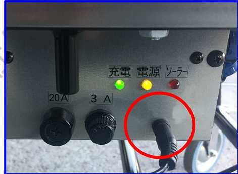
■充電は専用のコードで、100Vコンセントから行います。