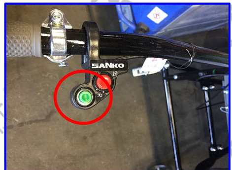
■後進ボタン(緑)を押しながら、スロットルスイッチを下げると後進します。