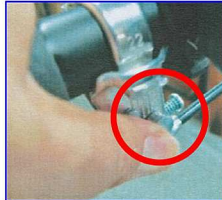
②ブレーキレバーを握り、ストッパーピンを押すと車輪がロックされます。