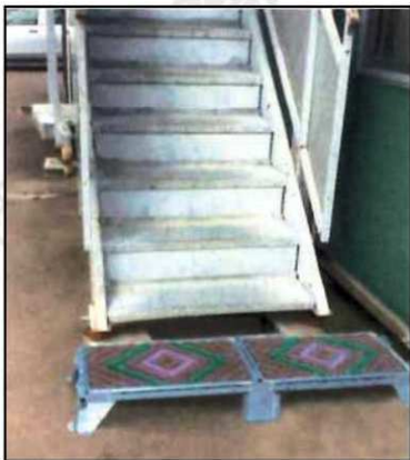
●ユニットハウスの階段前に設置