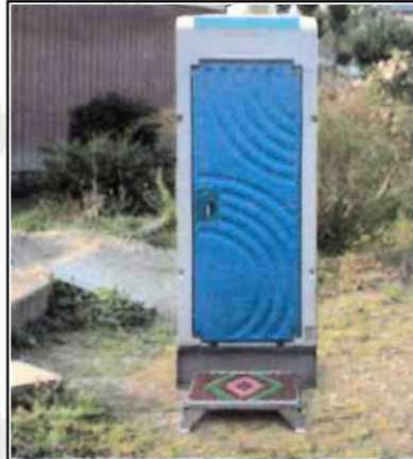
●仮設トイレ前に設置