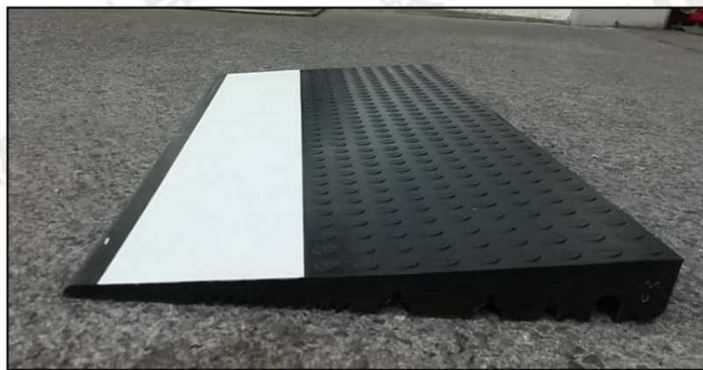
●高さは55mm・反射シート付。