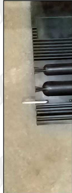
●ピンは裏に収納されています。