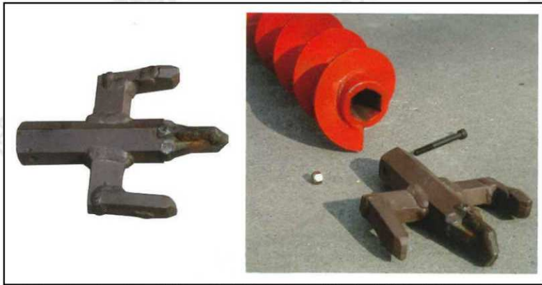
■エクステンションの先端に、強化型ポイントを付けて掘削します。（本体に1個付属です。）