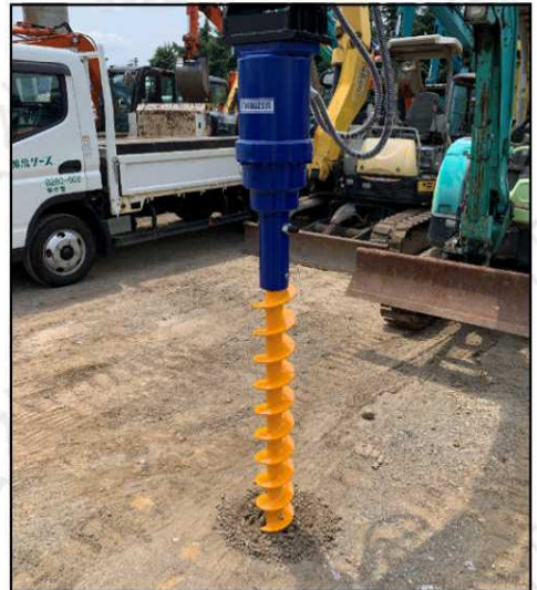
■狭小地の掘削にも最適です。

【仕様】 寸法：264×284×954mm 質量：93kg トルク：3000N・m 圧力範囲：7.8～23.5Mpa