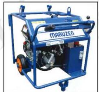
■油圧ユニットが必要です。