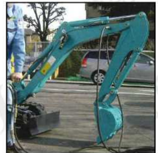
■ミニショベルの配管でも使用可能。