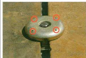
③敷鉄板にピンが2個ずつ噛んでいるか確認