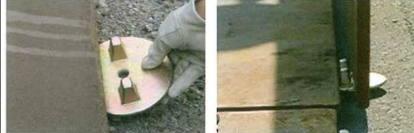
①下部を敷鉄板に挿入