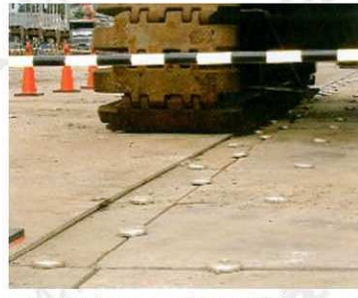
■重機走行のバタ付き防止に