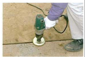
④ボルトを締め付け