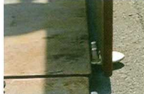
②隣の敷鉄板を敷設