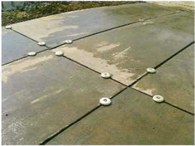
■鉄板のズレ防止に

20尺側には、両端部から300mm以内に、1ヶずつ真ん中に1ヶ合計3ヶ取り付けて下さい。 端部から300mm以上離すと敷鉄板がばたつきボルトがゆるみやすくなります。 5尺側に連結する場合1ヶ取り付けます。(スロープや力のかかる場所には、2ヶ取り付けて下さい)