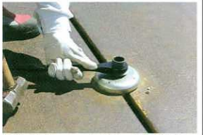
⑥ラジエツト等で本締め