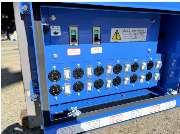
●100Vコンセントが12個。個別にスイッチがついています。