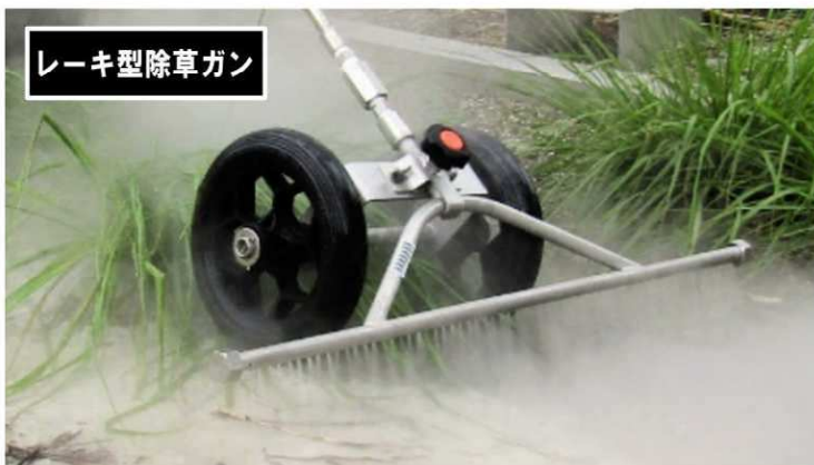
レーキ型除草ガン

■植物は通常42度以上でプロテインが死滅して枯れていきます。温水をかけても直後は変色せず、2～3日かけて進行していきます。