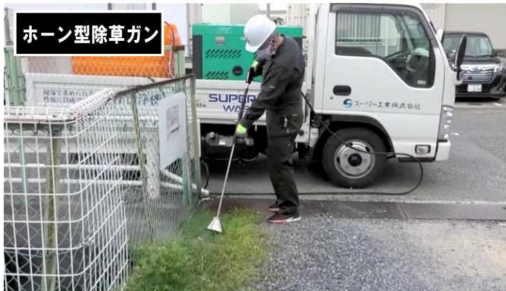
ホーン型除草ガン