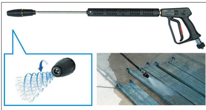
■（オプション）トルネードノズル