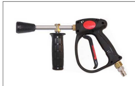
■（オプション）ショートガン 各種あり(L350~450)