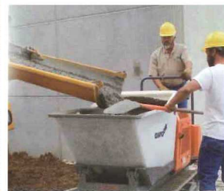
■生コン車から直接積載できます。