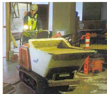
■生コン運搬OK。狭小地でも運航可能。