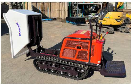
■90度までダンプアップします。