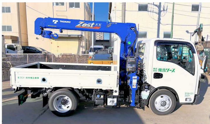
■全長4.6m。狭い道路でのクレーン作業に最適です。