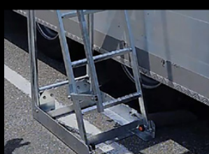
＜機能③＞ タイヤ固定の輪止めとして