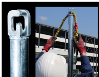
＜機能①＞ 親綱を張るための支柱として