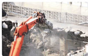
解体現場・工事現場