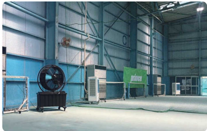
スポーツ施設・教育現場